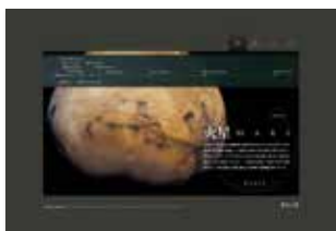
JST バーチャル科学館『惑星の旅』 [ http://jvsc.jst.go.jp/universe/planet/ ]

👑 平成17 年度文化庁メディア芸術祭エンターテインメント部門審査委員会推薦作品