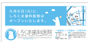
しろくま歯科医院・新聞広告『本日より診療開始』 [ http://www.shirokuma-d.com/ ]