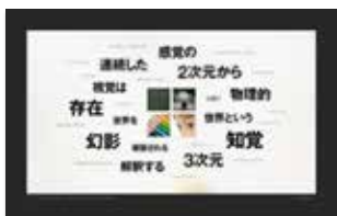
JST バーチャル科学館『マインド・ラボ』 [ http://jvsc.jst.go.jp/find/mindlab/index.html ]

👑 Web フォントデザインアワード2013 一般部門WebDesigning 賞