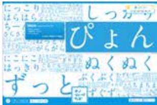
国立国語研究所 / オズマピーアール『オノマトペラボ』 [ http://onomatopelabo.jp/ ]

👑 Web フォントデザインアワード2013 一般部門WebDesigning 賞