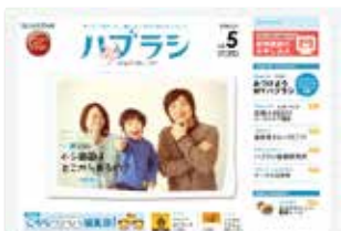
サンスター『haburashi.com』 [ http://www.haburashi.com/ ]