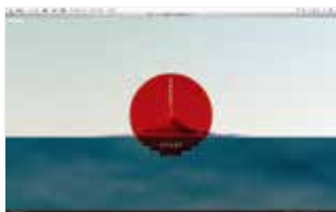
JST バーチャル科学館『日本再発見マップ』 [ http://jvsc.jst.go.jp/live/map/ ]